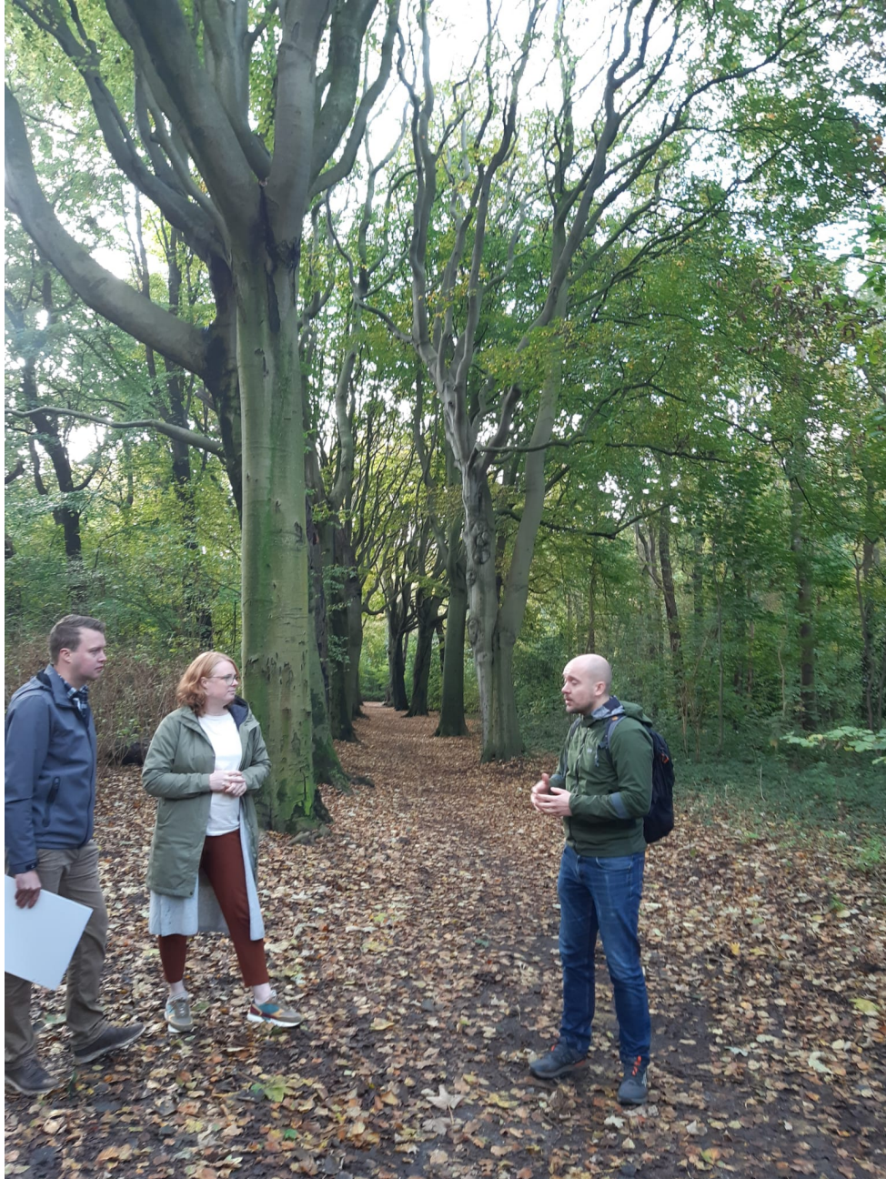
De prachtige beukenlaan

gecontroleerd. Om de veiligheid te garanderen kan het pad worden afgesloten voor bezoekers. De meningen binnen de groep zijn verdeeld over afsluiten. Het aanleggen van een nieuw pad kost heel veel ruimte waardoor er veel gekapt moet worden. Een lastig onderwerp waar heel goed over nagedacht moet worden.