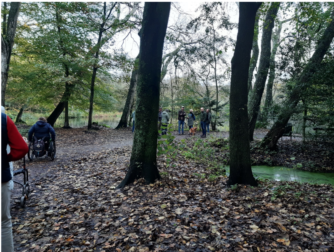
Soms slecht te zien waar het pad ophoudt en de bosgrond begint

Lopend naar de volgende plek kwam de vraag of de paden in de herfst beter schoongemaakt konden worden. Door de vele bladeren is niet te zien waar het pad ophoudt en de bosgrond begint. Met name voor mensen in een rolstoel of met een rollator is dat lastig. Ze komen of vast te zitten of erger komen te vallen. Ook de onverharde paden zijn voor hen lastiger te begaan.