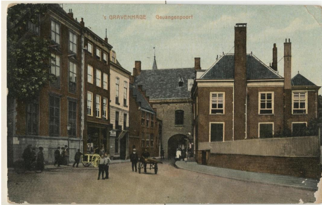
De gevangenpoort in 1912, voor het gedeelte langs de Hofvijver werd gesloopt

De wandeling begint bij de Gevangenpoort. Vroeger was dit een echte poort die toegang gaf tot het Buitenhof. Het gebouw is gedeeltelijk gesloopt om ruimte te maken voor het verkeer. Eeuwenlang was dit een echte gevangenis waar zowel eenvoudige als prominente mensen in hebben gezeten. Een van hen was de 17-eeuwse politicus Cornelis de Witt. Het standbeeld van zijn broer Johan de Witt staat op het plein en kijkt uit over de Lange Vijverberg, waar allebei de broers op een gruwelijk manier aan het einde van hun leven kwamen.